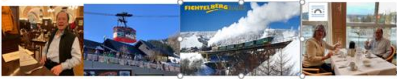
Mittagessen Leipzig „Auerbachs-Keller“ ..... Seilbahn- und Fichtelberg-Bahn ..... Frühstück in Oberwiesenthal