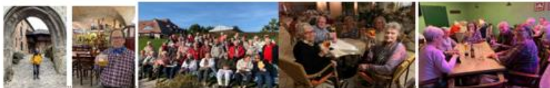
Burg Loket / Tschechien ..... hier drei Fotos von unserer letzte Reise – Rügen 2021