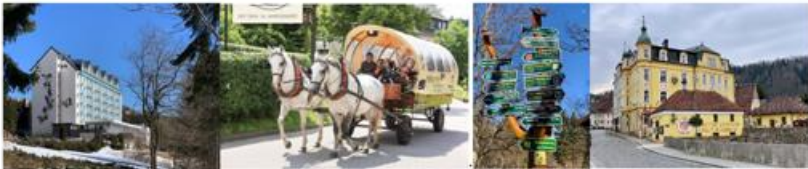
Best-Western-Hotel-Oberwiesenthal ..... Kremser Fahrt ..... Erdschweinbraten in Loket / Tschechien